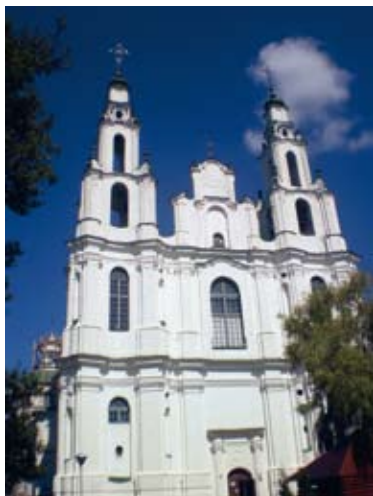
Sofia katedraal ...