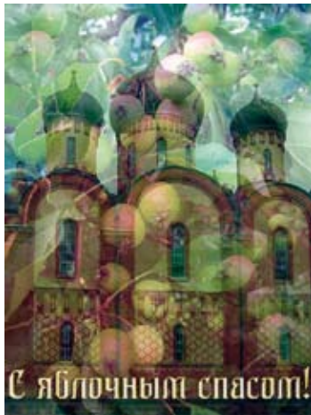
Head Jablotšnõi Spas'i püha!

Seda püha tähistatakse 19. augustil. Nime- tus on tulnud saagijumal Spasi nimest. Alg- selt peeti mitmeid Spasiga seotud püha- sid: näiteks seene-, leiva-, marjapüha. Neist tuntumad olid kolm püha: Mee Spas, Pähkli Spas ja kõige tähtsam – Õuna Spas ( Jablotšnõi Spas ).