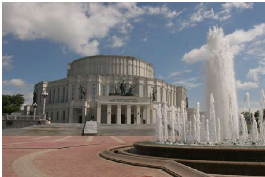
Valgevene Riiklik Akadeemiline Suur Ooperi- ja Balletiteater.

Valgevene teatri juured peituvad väga ammustes kombetalitustes ning rahvuslikes mängudes. Kui esialgu osales neis kogu külarahvas, siis ajapikku kerkisid esile professionaalsed näitlejad – rändmuusikud ja narrid. Neid nimetati XI sajandini väga erinevalt, näiteks gutšõ , pljastsõ ('vilistajad, tantsumehed'), ja nende loomingus võis eristada draama-, muusika-, vokaalseid, tantsu-, tsirkuse-, estraadielemente – seda kuni XX sajandini.