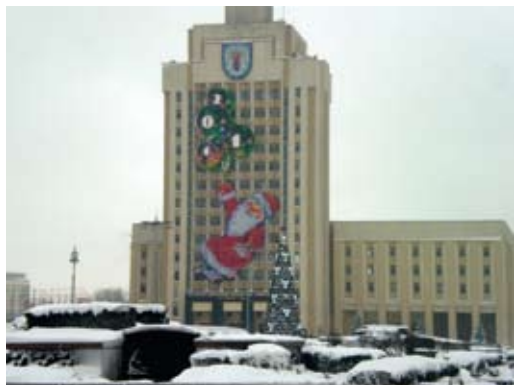
Valgevene vanemaid kõrgkoole, Maksim Tanki nimeline Valgevene Riiklik Pedagoogiline Ülikool.

Hariduse andmisest Valgevenes võib rääkida alates X sajandist – ajast, mil Venemaa võttis omaks ristiusu. Valgevenes oli hariduselu samuti seotud õigeusuga ja sellele panid aluse piiskopiteaduskond Polatskis (992) ja Turovis (1005).