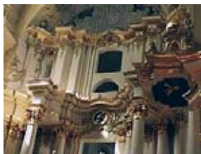
... ja selle sisevaade.