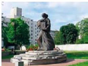
Mälestussammas Kirill Turovskile Valgevene Riikliku Ülikooli linnakus.

Kirjanik-jutlustaja Kirill Turovski (1130–1182) loomingu põhiteemaks oli inimene. Tema kirjanduslik pärand kujunes sedavõrd mahukaks, et teist sellist kirjameest kaasaegsete seast tema kõrvale ei leia.